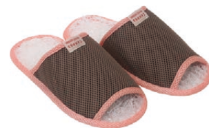
NEW 9254-0083 キャンパス ブリーザブルスリッパ PK

price : ¥2,000 (税込¥2,200) size : フリーサイズ (23-25cm) material : ポリエステル、POE