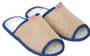
NEW 9254-0081 キャンパス ブリーザブルスリッパ BL

price : ¥2,000 (税込¥2,200) size : フリーサイズ (23-25cm) material : ポリエステル、POE