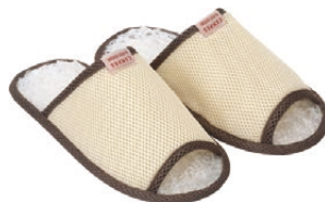
NEW 9254-0082 キャンパス ブリーザブルスリッパ BR

price : ¥2,000 (税込¥2,200) size : フリーサイズ (23-25cm) material : ポリエステル、POE