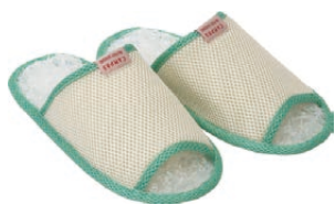
NEW 9254-0080 キャンパス ブリーザブルスリッパ MGR

price : ¥2,000 (税込¥2,200) size : フリーサイズ (23-25cm) material : ポリエステル、POE